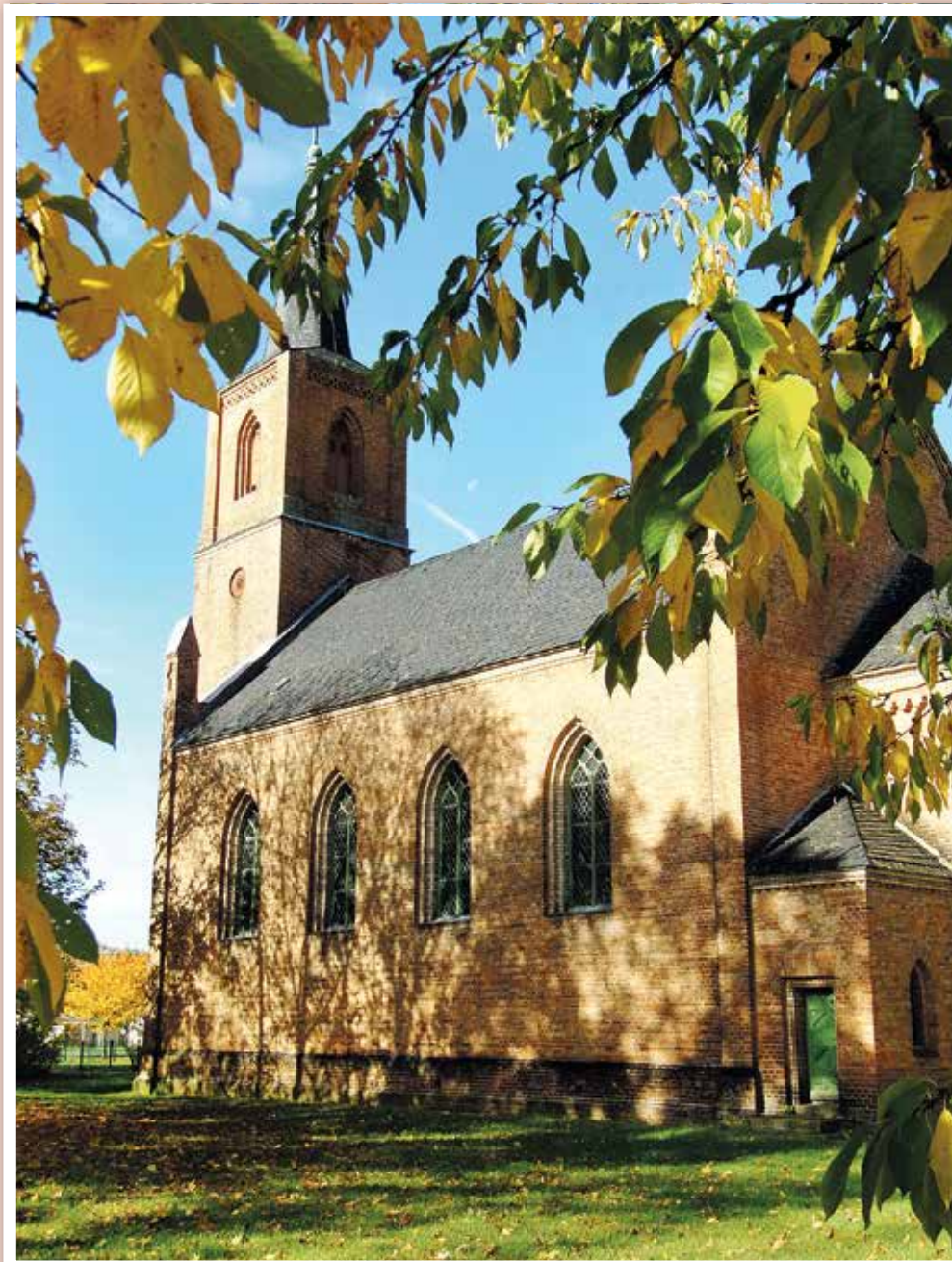
Kirche in Wesendorf