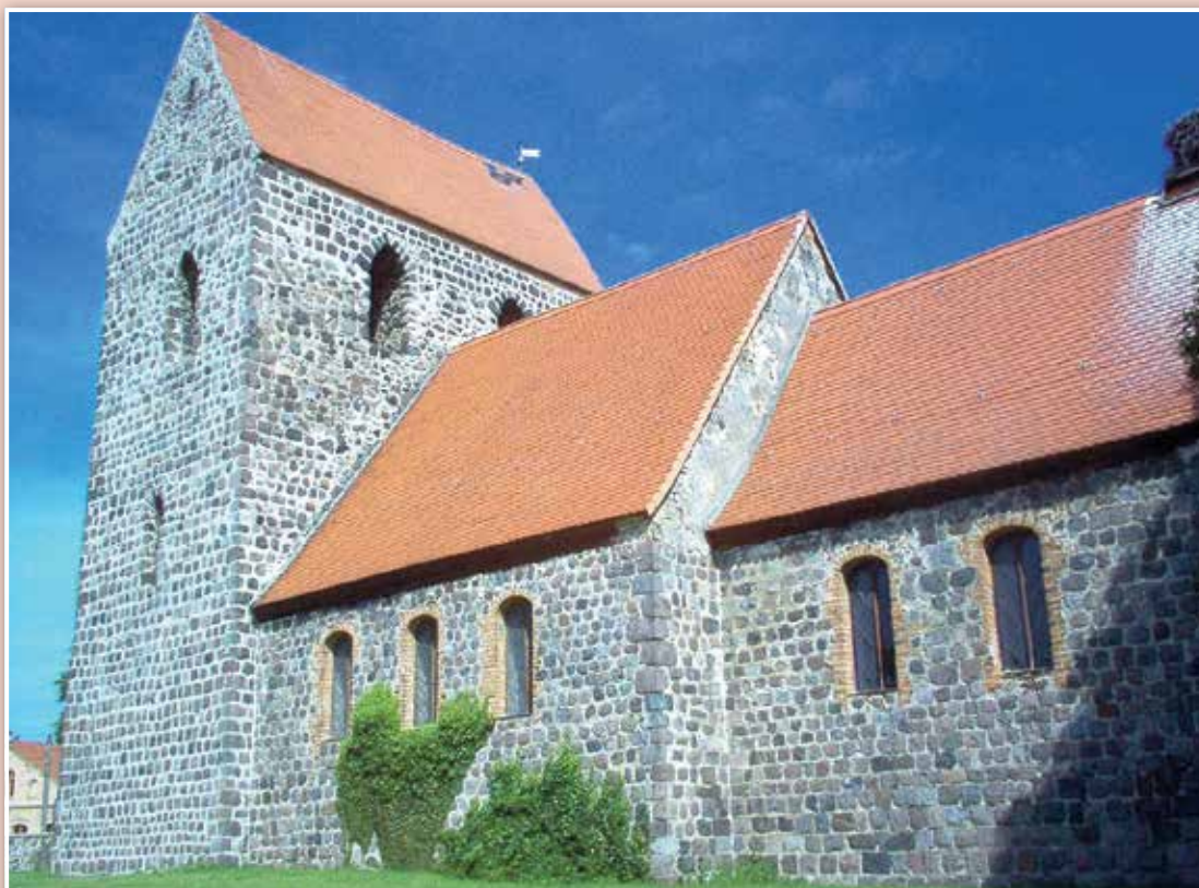
Die Kirche heute

Die Kirche in Bergdorf, das in diesem Jahr das 750-Jahre-Jubiläum seiner urkundlichen Ersterwähnung feiert