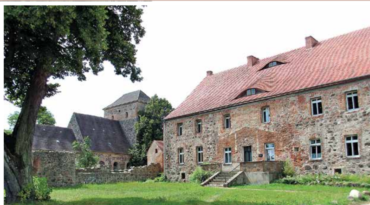
Festes Haus Badingen mit Kirche 2012